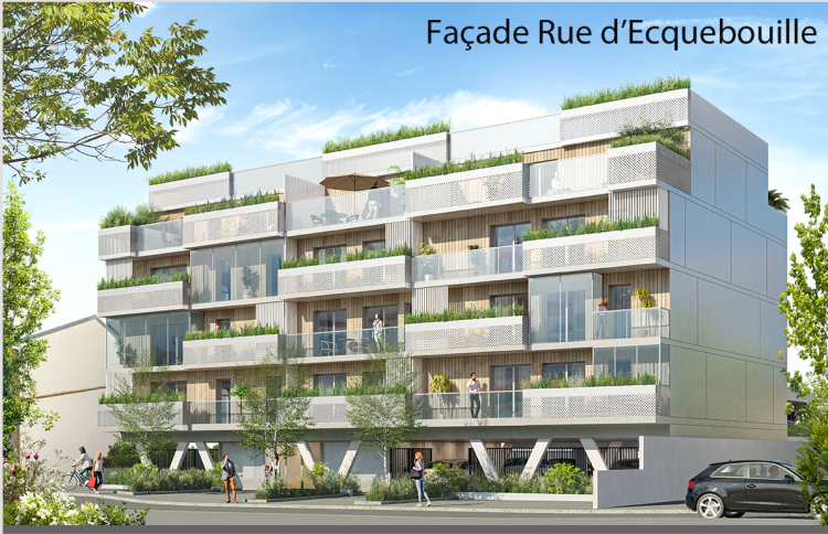
Façade Rue d'Ecquebouille